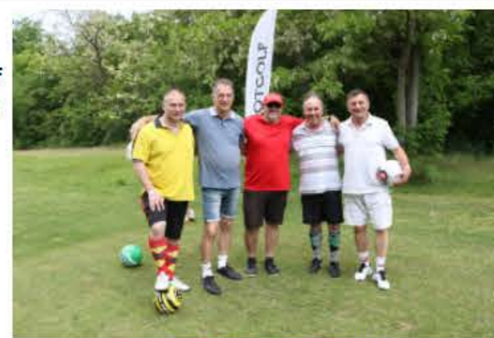
Tovább a képgalériába