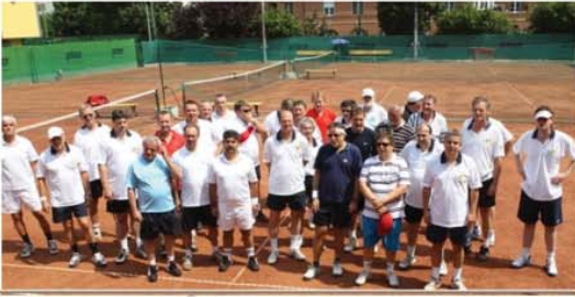
Kattintson a tenisztorna fotóihoz! „Tisztelet Ász!” Társasági Tenisztorna végeredmény 2011. június 5.