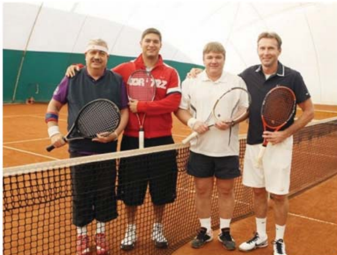
25. „Tisztelet Ász!” Társasági Teniszturna végeredmény 2010. december 5.