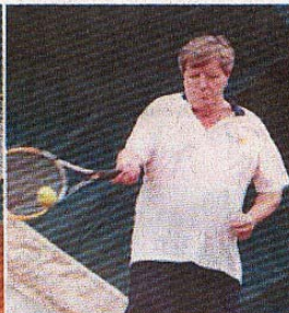
Dr. Stumpf István alkotmánybíró