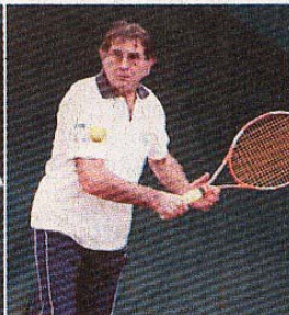
Dr. Kerényi János parlamenti képviselő (FIDESZ)