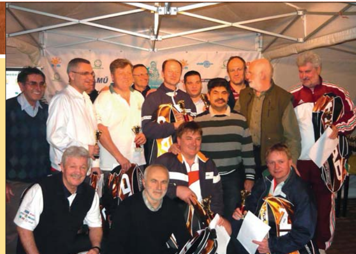
A tornagyőztes kormány csapat

egyedül vagyok MSZP-s képviselő. A megye minden területére nekem kell menni. És otthon is be kell pótolni a családnál az elmaradt dol- gokat.