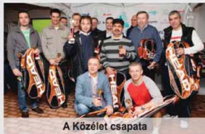
A Közélet csapata