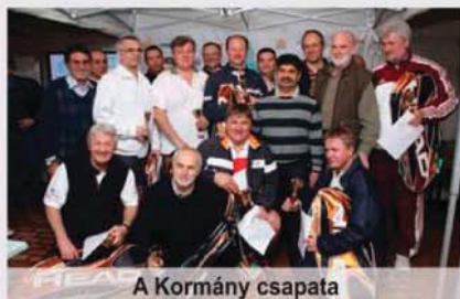
A Kormány csapata

A rendezvény fővédnöke: Dr. Kövér László, az Országgyűlés elnöke, védnökei: Bánki Erik, az Országgyűlés Sport és Turisztikai Bizottsága elnöke és Czene Attila, a Nemzeti Erőforrás Minisztérium sportért felelős államtitkára voltak.